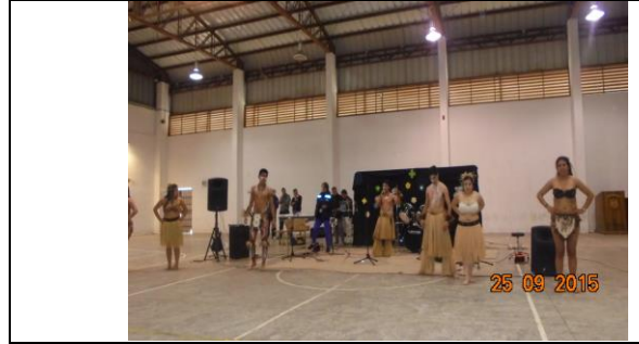
IMG. N° 003 Reinserción social: Sub programa de Deporte, Recreación, Arte y Cultura, E.P Puerto Montt.

Comentario: Se realiza evento de celebración de Fiestas Patrias organizado por el Liceo Coresol, se registra un total de 160 internos participantes correspondiente a los Módulos 21, 22, 52 y 40'. En la ocasión se realizan juegos típicos chilenos, entre otros gymkana, la cuerda, silla musical.