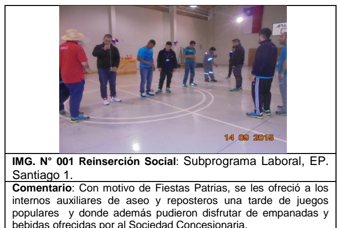
IMG. N° 001 Reinserción Social: Subprograma Laboral, EP. Santiago 1.

En el marco de la celebración de las Fiestas Patrias se realizaron actividades de celebración en los tres Establecimientos Penitenciarios, los cuales se muestran a continuación