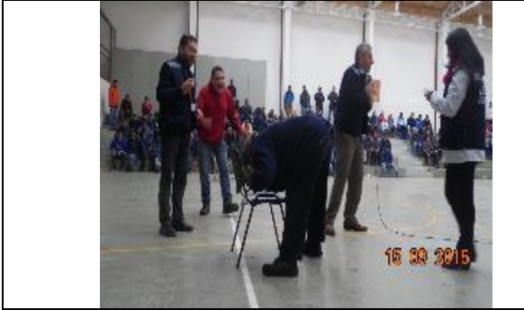
IMG. N° 002 Reinserción Social: Subprograma Laboral, EP Valdivia.

Comentario: Se realiza evento de celebración de Fiestas Patrias organizado por el Liceo Coresol, se registra un total de 160 internos participantes correspondiente a los Módulos 21, 22, 52 y 40'. En la ocasión se realizan juegos típicos chilenos, entre otros gymkana, la cuerda, silla musical.